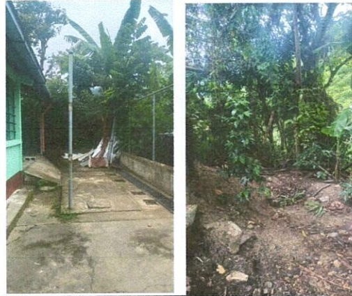
Foto 1: Vista de la necesidad de reparación de planta de tratamiento de aguas grises (sistema de drenaje y depósito de agua entubada)